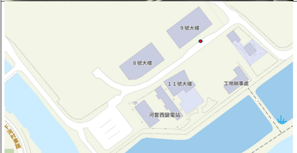
上落客点位置: 港深创科园 9 号大楼正门